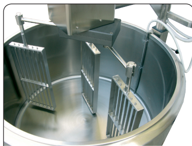
Tridelná sirarská harfa (opcija)