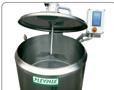
Enodelni pokrov (opcija)

Brezstopenjska regulacija hitrosti mešala • Mešalo 75% premera posode